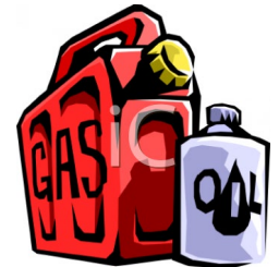
Productos de petróleo