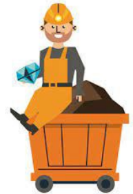
Residuos de construcción