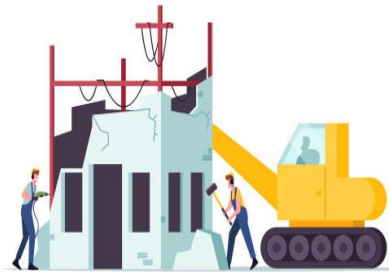
Escombros de demolición